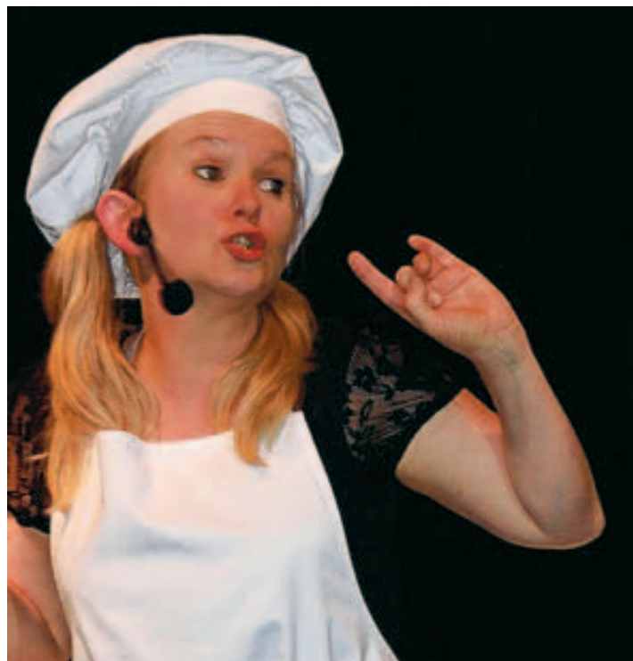
Humoriste sur la scène comme dans la vie de tous les jours. ■ DA-P

Un thème inspiré de vos vacances? "Avec plusieurs couples d'amis, on a loué une maison en Forêt Noire. Le partage de la salle de bain constituera le sujet d'un prochain spectacle. Je me lève, c'est occupé. Je reviens, c'est toujours occupé par la nénéte qui y passe trois heures chaque jour. Le week-end est fini quand nous avons toutes eu l'occasion de nous doucher. Puis il y a aussi la copine belle,